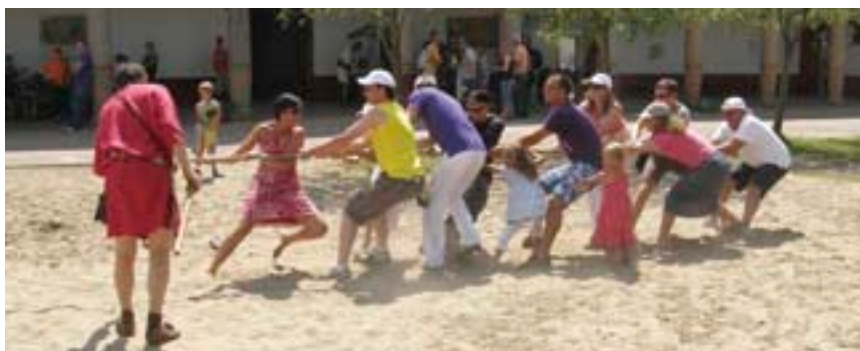
Personeelsfeest Lansigt 2010 in Archeon.