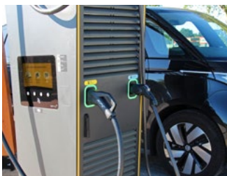
5 Tips voor de automobilist