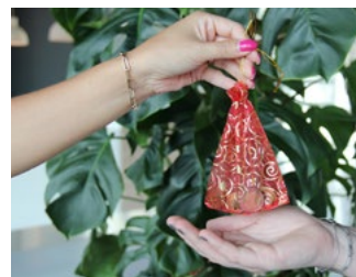
7 Tips inzake de btw