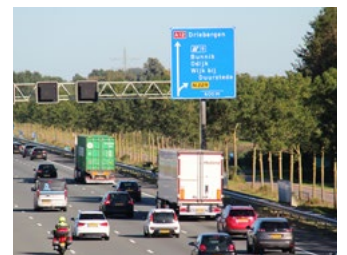
4 Tips voor werkgevers