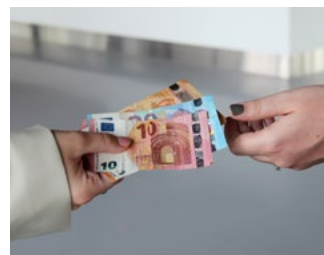
3 Tips voor de bv en de dga