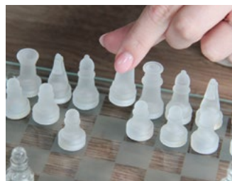
2 Tips voor de ondernemer in de inkomstenbelasting